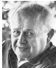
Dr. Moshe Feldenkrais (1904 - 1984)